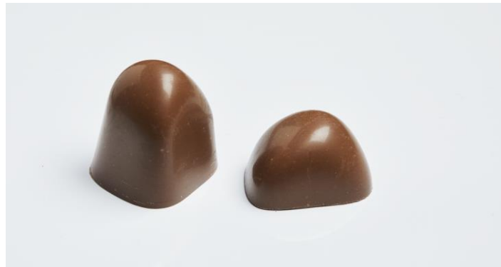
Een heerlijke kop koffie

Bij meer foto's tonen we enkele vergelijkbare voorbeelden en ook een afzonderlijke decoratie, met een quick melter, om snel te kunnen bijsmelten. Op www.prefamac.com kan je alles terugvinden.